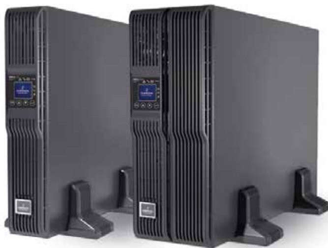
Liebert® GXT4™ 700 - 3000 VA