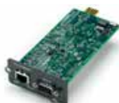
Carte de communication Liebert® Intellislot®